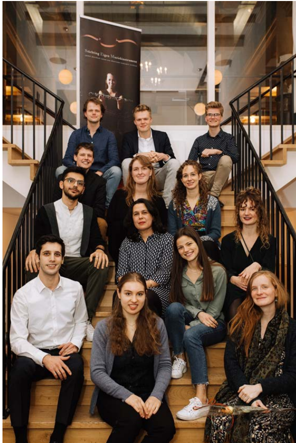
Foto: Aanvragers najaarsronde 2019 in de Uilenburgersjoel te Amsterdam